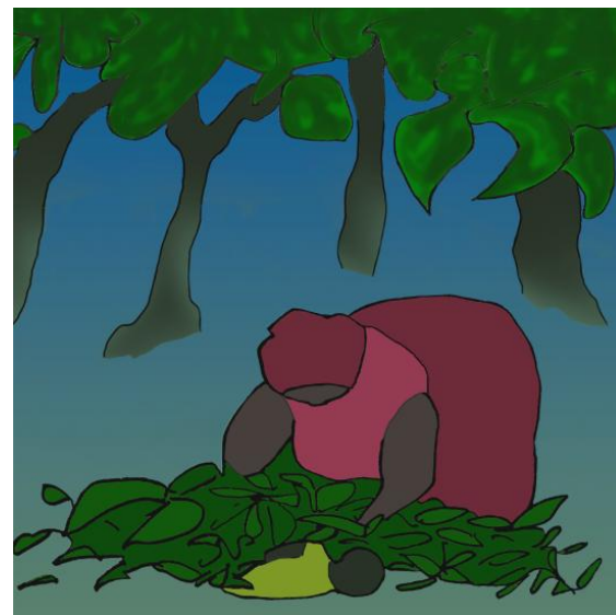
Бабуся заховала Тінгі у купу листя.