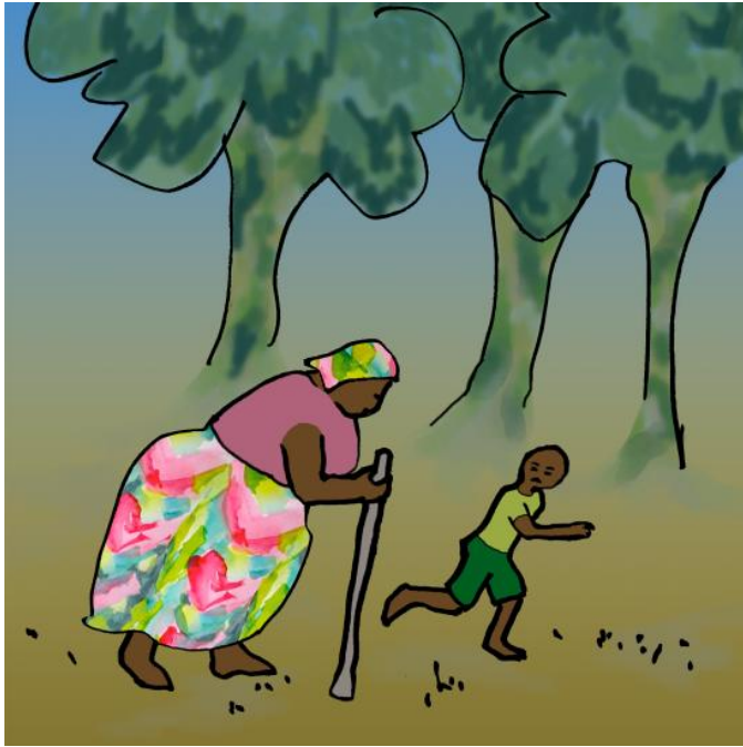
Tingi y su abuela huyeron para esconderse.