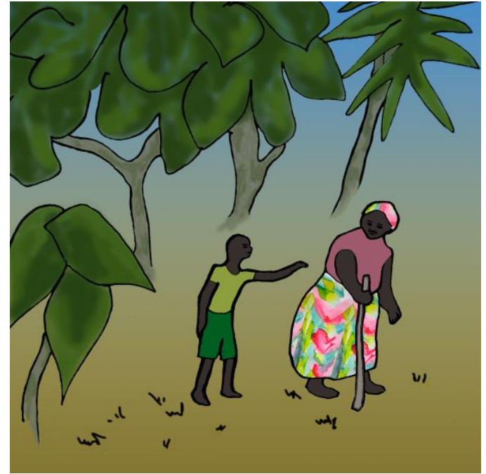
Cuando estuvieron a salvo, Tingi y su abuela salieron.