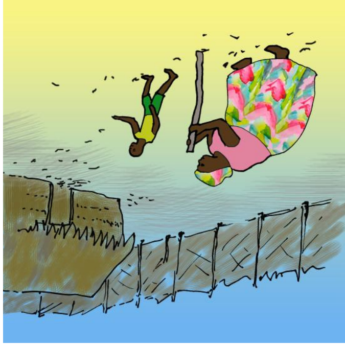
Se escabulleron a casa muy tranquilamente.