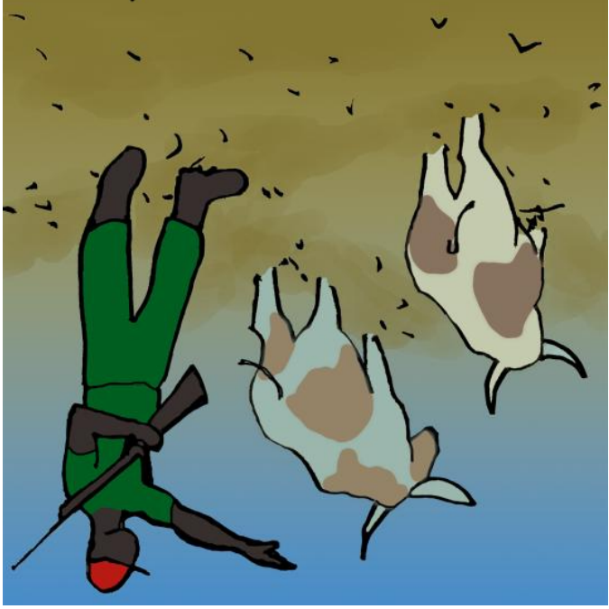
Se llevaron las vacas.