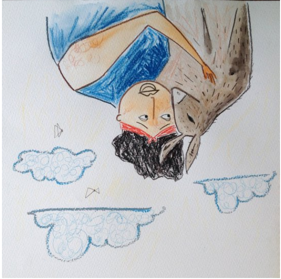
最靚，佢決定接受呢個仔，做佢嘅媽咪。

Un matin, le vieil homme demanda à Âne de le transporter jusqu'au sommet d'une montagne.