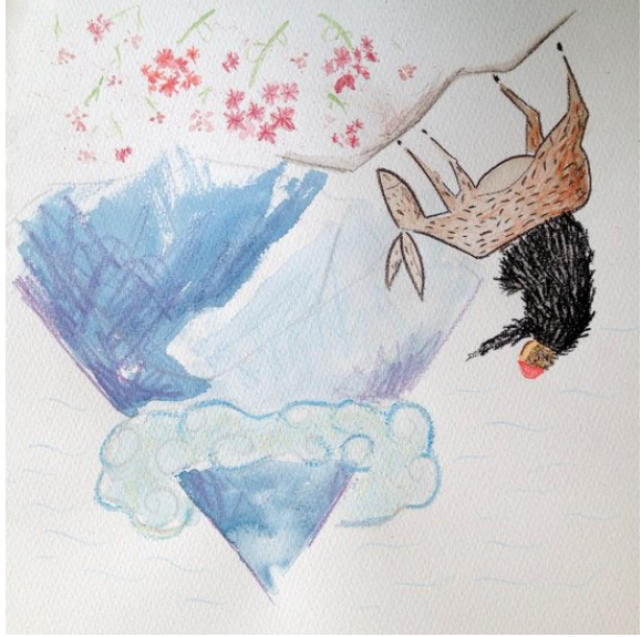
一日朝頭早，老人叫驢仔帶佢去山頂上面。