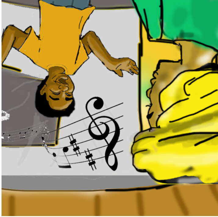
La chanson de Sakima

✎ Ursula Nafula 👤 Peris Wachuka 📄 Anu Gill 🗣️ Punjabi / French 📖 Level 3