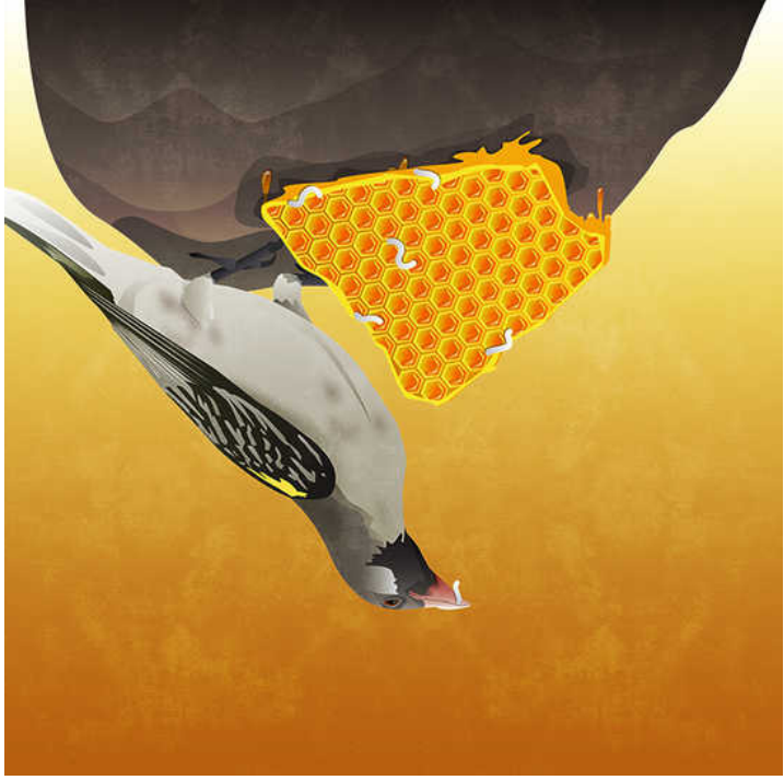
The Honeyguide's revenge

✎ Zulu folk tale 🗣️ Wiehan de Jager 📖 Anu Gill 🗣️ Punjabi / English 📖 Level 4