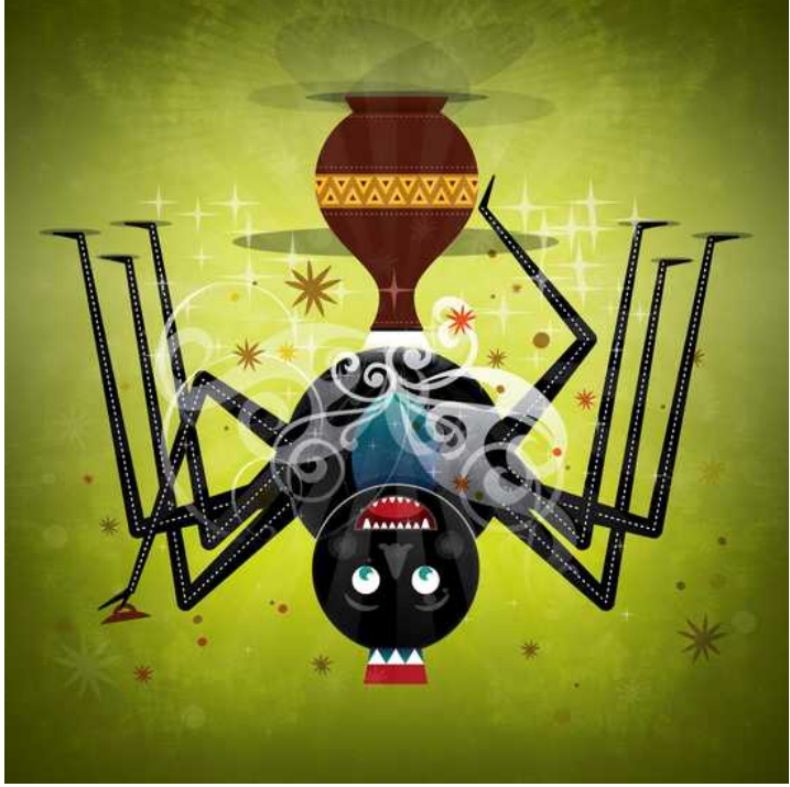
Anansi et la sagesse

✎ Ghanaian folk tale 🔗 Wiehan de Jager 📖 Jong Yong Park 😊 Korean / French 📊 Level 3